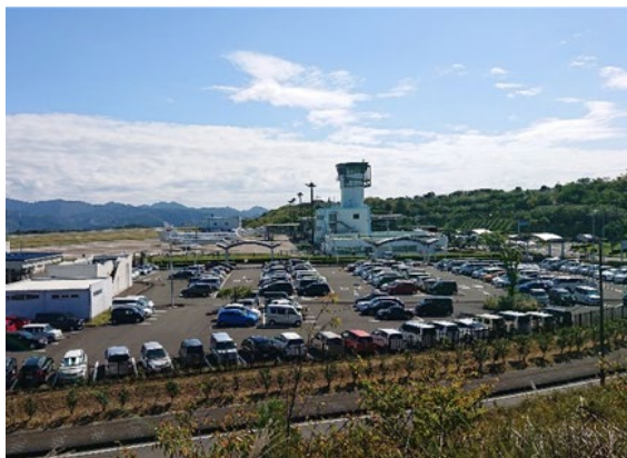
増設する駐車場からの景色 (手前に見えるのは既存駐車場)