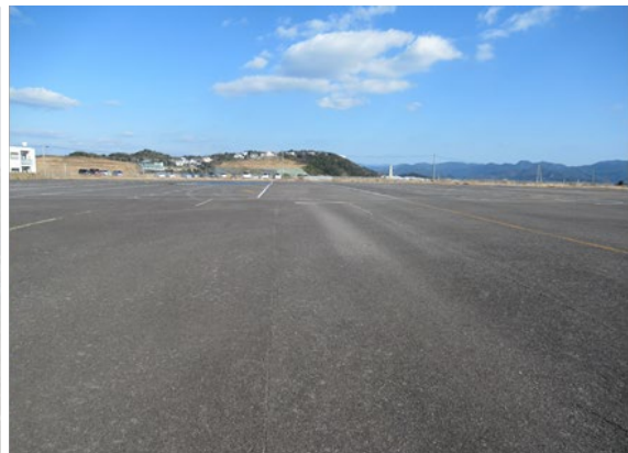
元白浜空港敷地 (駐車場の増設エリア)