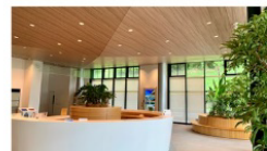
空港ターミナルビル