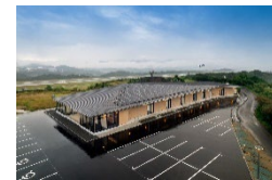
空港公園に官民連携で設置されたワーケーションオフィス