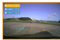
ドライブレコーダーとAI技術を活用し、滑走路点検を省力化