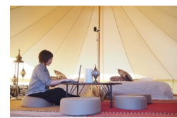
旅行業の資格を生かしたワーケーション人材の取込みによる地域活性化