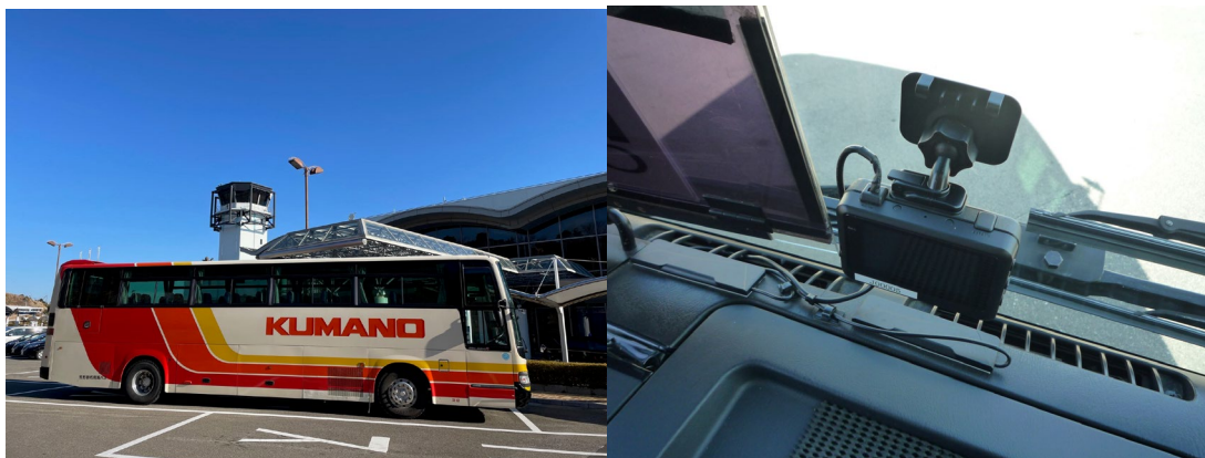
空港リムジンバス（全景）

https://www.mlit.go.jp/sogoseisaku/maintenance/03activity/pdf/05_19.pdf