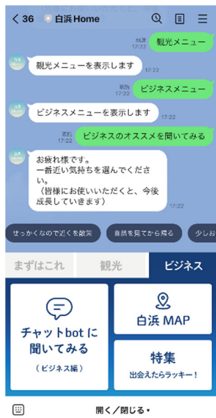
チャット方式で回答する 画面例 1