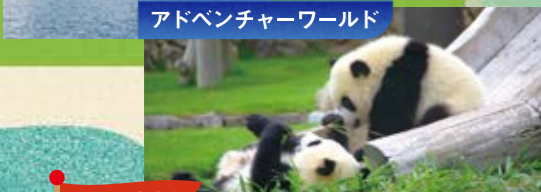
アドベンチャーワールド