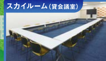
スカイルーム(貸会議室)

「交流によって生まれる」新しい発見。一般利用も可能なワークスペースでテレワーク。ビジネスの種が見つかるかも。