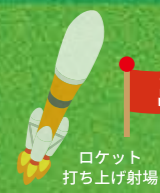
ロケット打ち上げ射場