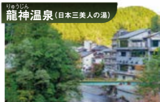
群馬の川中温泉、島根の湯の川温泉と並ぶ龍神温泉。弘法大師が難陀龍王の夢のお告げにより浴場を開いた事から龍神温泉の名がつけられたと伝えられ、以来千三百年の歴史を持つ温泉です。